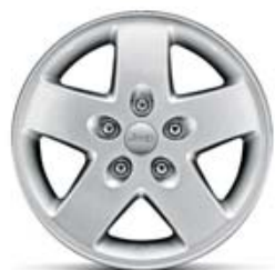
Aluminio de 17" Opcional en Sport.