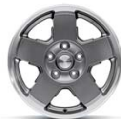
Aluminio pintado de 17" Diseñado por Mopar.