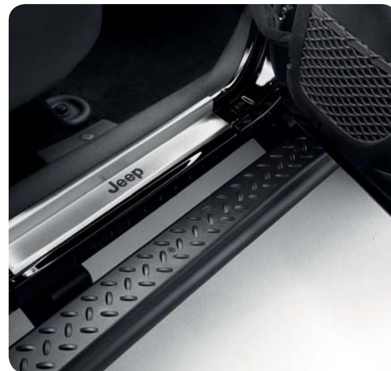
Protectores inferiores de las puertas en acero con logo Jeep.