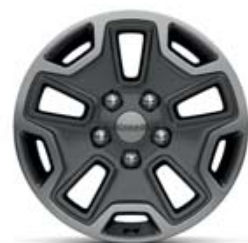
Aluminio de 17" De serie en Rubicon.