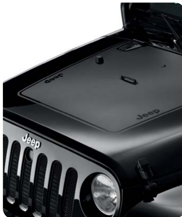
Adhesivo para el capo en Negro Mate y con logo Jeep. También disponible en Gris Mate.