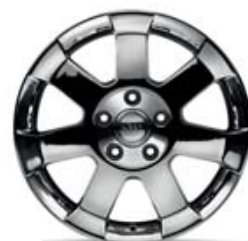
Aluminio cromado de 18" diseñado por Mopar