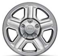
Acero de 16" De serie en Sport.