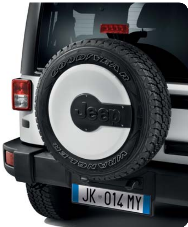
Cobertor de la rueda de repuesto.