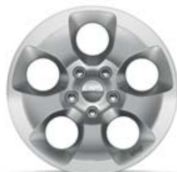
Aluminio de 18" De serie en Sahara.